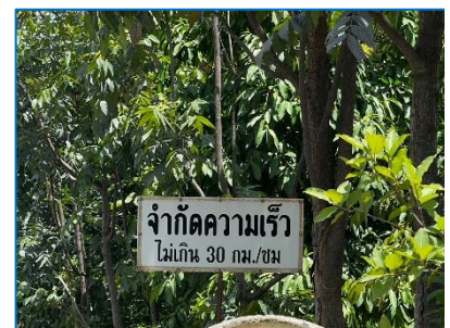
ป้ายจำกัดความเร็ว