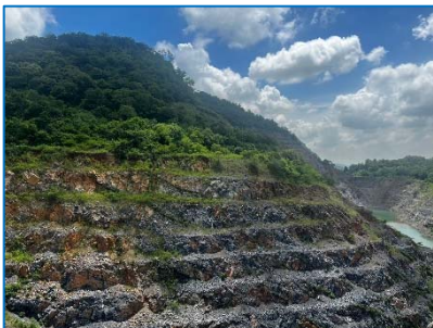
หน้าเหมืองลักษณะขั้นบันได