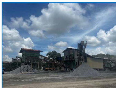
โรงโม่หินของโครงการ