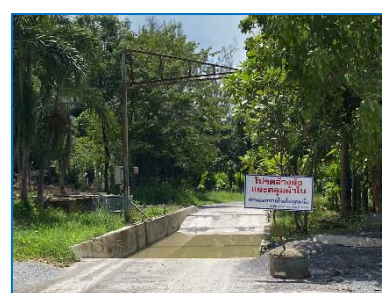
บ่อล้างล้อ