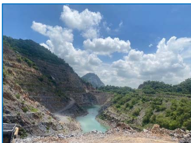
หน้าเหมืองปัจจุบัน