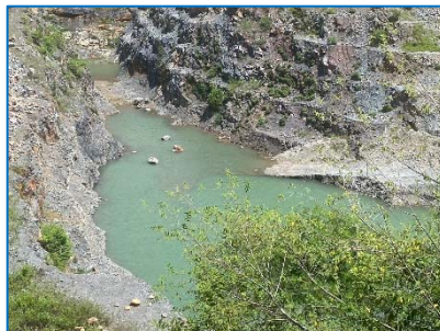
จุดต่ำสุดเป็นพื้นที่รองรับน้ำหน้าเหมือง