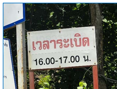
ป้ายเวลาการกระเปิด