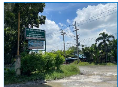
ป้ายสำนักงานโครงการ