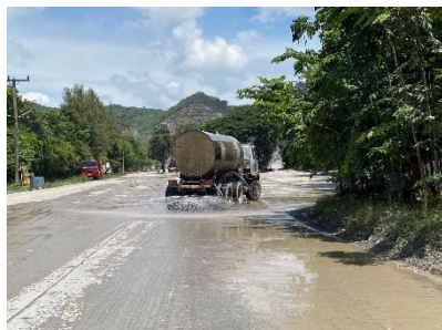
รถฉีดพรมน้ำ