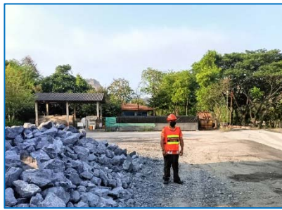
พนักงานสวมใส่อุปกรณ์ป้องกันอันตราย